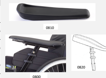
Bracciolo per emplegico Con. N.T. 18.09.39.030