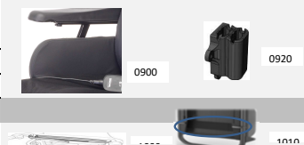
Pelotte toracali Cod. N.T. 18.09.39.148

Per scoprire di più sul nostro ampio catalogo di pelotte e poggiatesta e tutti gli altri accessori collegati al microsite dedicato e scopri come adattare gli